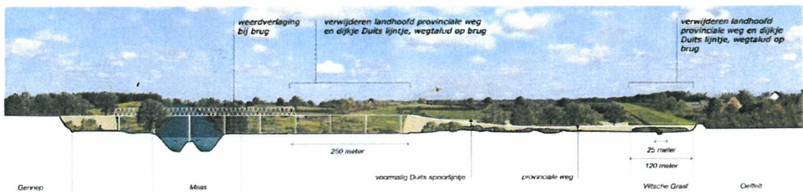
2 Doorlatend maken landhoofd (2 openingen) en weerdverlaging, uitzicht vanaf Veerstoep naar het zuiden